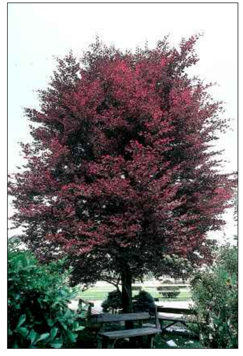
FAGUS SYLVATICA "TRICOLOR" (faggio rosso)