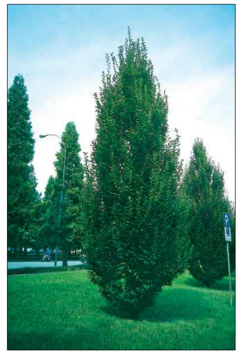
CARPINUS BETULUS "PYRAMIDALIS" (carpino bianco)